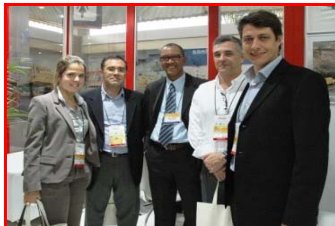
Equipe da PROMON