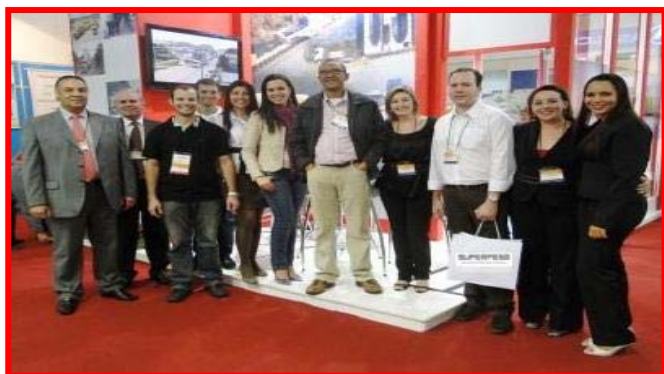
Equipe: Decom RJ / Decom SP / Base Macaé